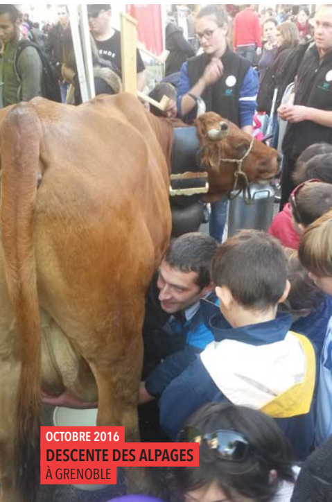
OCTOBRE 2016 DESCENTE DES ALPAGES À GRENOBLE