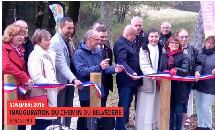
NOVEMBRE 2016 INAUGURATION DU CHEMIN DU BELVÉDÈRE À VOREPPE