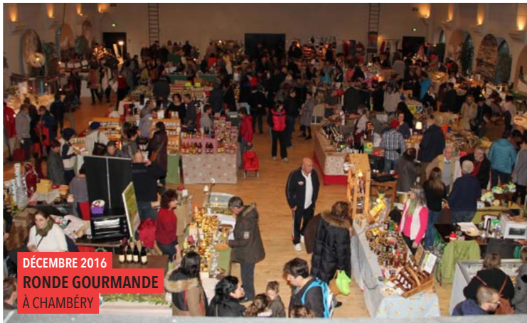
DÉCEMBRE 2016 RONDE GOURMANDE À CHAMBERY