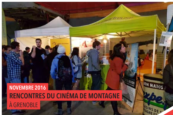
NOVEMBRE 2016 RENCONTRES DU CINÉMA DE MONTAGNE À GRENOBLE