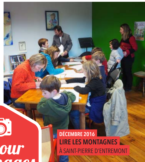
DÉCEMBRE 2016 LIRE LES MONTAGNES À SAINT-PIERRE D'ENTREMONT